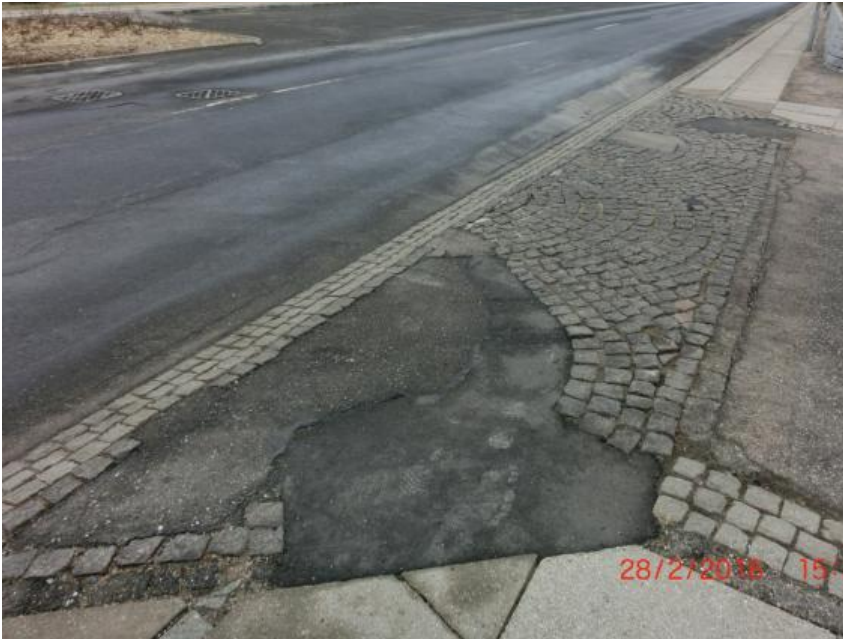
Overkørsel ved Strandpromenaden

Grundejerforeningen accepterer at Roskilde Kommune i forbindelse med istandsættelse af overkørslerne, fra Strandpromenaden til de fire stikveje, nyudfører overkørslerne i sf-sten, som alternativ til istandsættelse af de nuværende overkørsler udført i chaussé-sten.