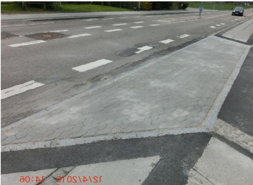
Ny overkørsel ved Baunegårdsvej